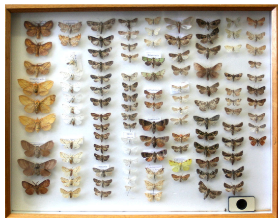
Abb. 3: Heyden's Eulenkasten aus Jasnitz