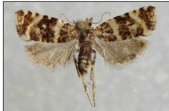
Abb. 9: Phiaris micana D. & S., 15 mm, diese Art wird in MV vorrangig in Kalk-Quellmooren häufig gefunden.

Franzburg 02.-15.06.2009, 24.06.2010 (TABBERT)