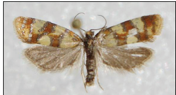
Abb. 4: Aethes tesserana D. & S., 17 mm

4309 -smeathmanniana (FABRICIUS, 1781) (07.05.-20.08.) Altefähr 1980, Drigge 1993, 2003, Negast 1998, 2003, 2004, 2008, 2009, 2011, Dargast 2002, 2003, 2007, Prora 2002, Neustrelitz 2003, Altwarp 2007, Stedar 2009, 2010, Endingen 2011, Abtshagen 2009, Klein Trebbow 2005 (TABBERT); Gnewitz 2001, Serrahn 2001, Gnoien 2001, Neustrelitz 2000 (HOPPE); Neustrelitz 2008, 2009 (BAUMGARTEN)