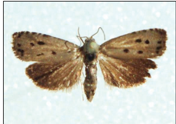
Abb. 14: Cydia zebeana RZBG. 14 mm

Serrahn 28.05.2001, 19.06.2001, Gnewitz 2001 (HOPPE)