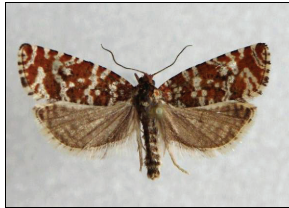
Abb. 8: Phiaris schulziana FABR., 17 mm, diese Art ist in den meisten Sauer- Armmooren in MV häufig anzutreffen