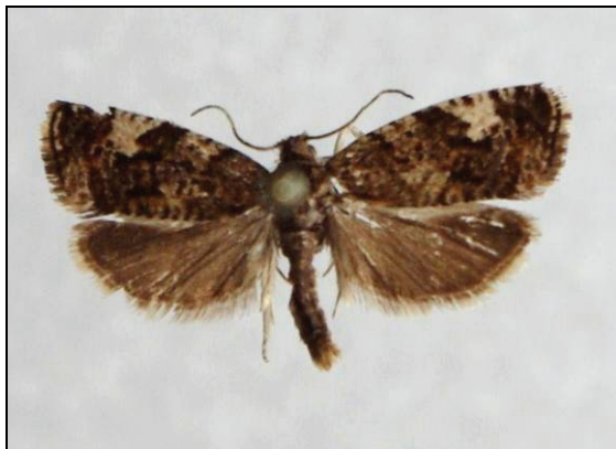
Abb. 10: Argyroploce lediana L., 14 mm, sehr seltene tyrphophile Art

(30.05.-16.07.) Dargast 2003, Negast 2010 (TABBERT); Bug/Rügen 2001 (HOPPE); Darßwald 2001 (WACHLIN, HOPPE); Adamsdorf 2009, 2011 (BAUMGARTEN)