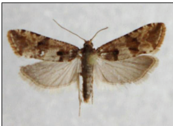
Abb. 11: Lobesia littoralis H. & W., 13 mm

(13.05.-22.07.) Negast 2003, Pennin 2009, NSG Försterhofer Heide 2011 (TABBERT); Lüttenhagen 2001, Gnewitz 2001, Serrahn 2001 (HOPPE); Neustrelitz 2011 (BAUMGARTEN)