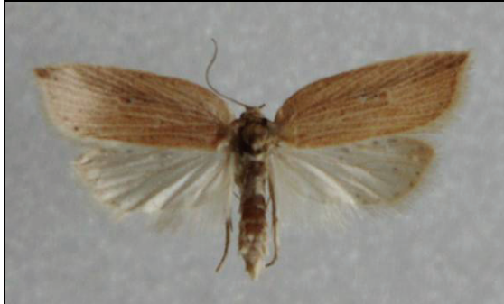
Abb. 5: Acleris lorquiniana DUP. 18 mm