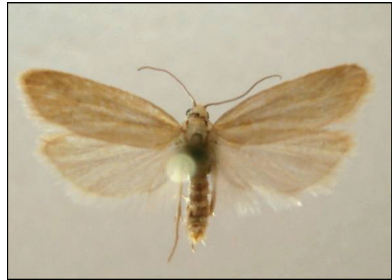
Abb. 3: Aethes margaritana HAW., 15 mm, bei Negast kommen zu etwa 10% einfarbige oder hellbraun/gelblich längsgestreifte Formen vor.

4294 Aethes hartmanniana (CLERCK, 1759) (05.06.-01.08.) NSG Försterhofer Heide 1992, Prora 2000, Gützkow/Peenetalwiesen 2003 (TABBERT)