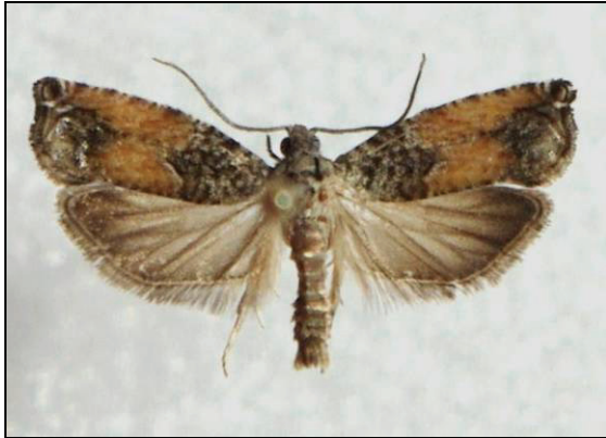
Abb. 12: Epinotia nisella CL., 16 mm, eine bisher noch nicht abgebildete Form

4878 -nisella (CLERCK, 1759) (07.06.-18.09.) Pennin 1981, Prora 2002, 2003, 2004, 2009, Dargast 2003, Endingen 2010, Negast 2009, 2010, 2011, NSG Försterhofer Heide 1991, Abtshagen 2009, Neustrelitz 2011 (TABBERT); Dudendorf (HOPPE); Neustrelitz 2008, 2009, 2010 (BAUMGARTEN)