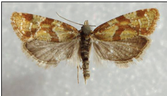
Abb. 2: Aethes hartmanniana CL., 16 mm, dieser Beleg stimmt äußerlich weitgehend mit der in RAZOWSKI, 2001 (Tafel 4, Abb. 84) dargestellten Aethes piercei OBRAZTSOV, 1952 überein. Da die Art noch umstritten ist, sind weitere Untersuchungen notwendig.

4288 -ambiguella (HÜBNER, 1796) Neustrelitz 30.05.2011 (BAUMGARTEN); Dänschenburger Moor 2005 (RUDOLPH & HOPPE)