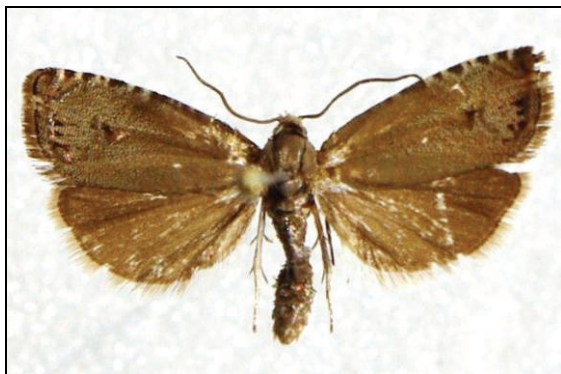
Abb. 13: Cydia millenniana ADAM. 15 mm