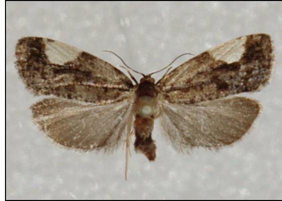
Abb. 6: Hedyia dimidiana CL., 19 mm

4715 -pruniana (HÜBNER, 1799) (26.05.-31.07.) Altfähr 1980, Drigge 1994, Stedar 2010, Endingen 2009, 2010, 2011, Kratzeburg 2009 (TABBERT); Serrahn 2001 (HOPPE); Neustrelitz 2011 (BAUMGARTEN)