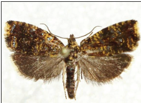
Abb. 7: Celypha siderana TR., 16 mm

(15.06.-03.07.) Negast 2002 (6F), 2003 (11F), 2006 (5F), 2009 (2F), 2010 (2F, 7R) (TABBERT)