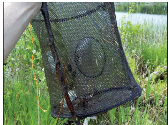
Abb. 2: Selbstgebaute Wasserkäferfalle, die vor allem für den Fang von Käfern der Gattung Dytiscus , Cybister und Hydrophilus geeignet ist. Hinten ist der Trichter aus Fliegengaze zu erkennen.

auch von Herpetologen erfolgreich als Molchreusen genutzt werden (z. B. HAACKS & DREWS 2008). In den Niederlanden kamen für die Suche nach Dytiscus latissimus auch spezielle Molchreusen zum Einsatz (CUPPEN et al. 2006, REEMER et al. 2008).