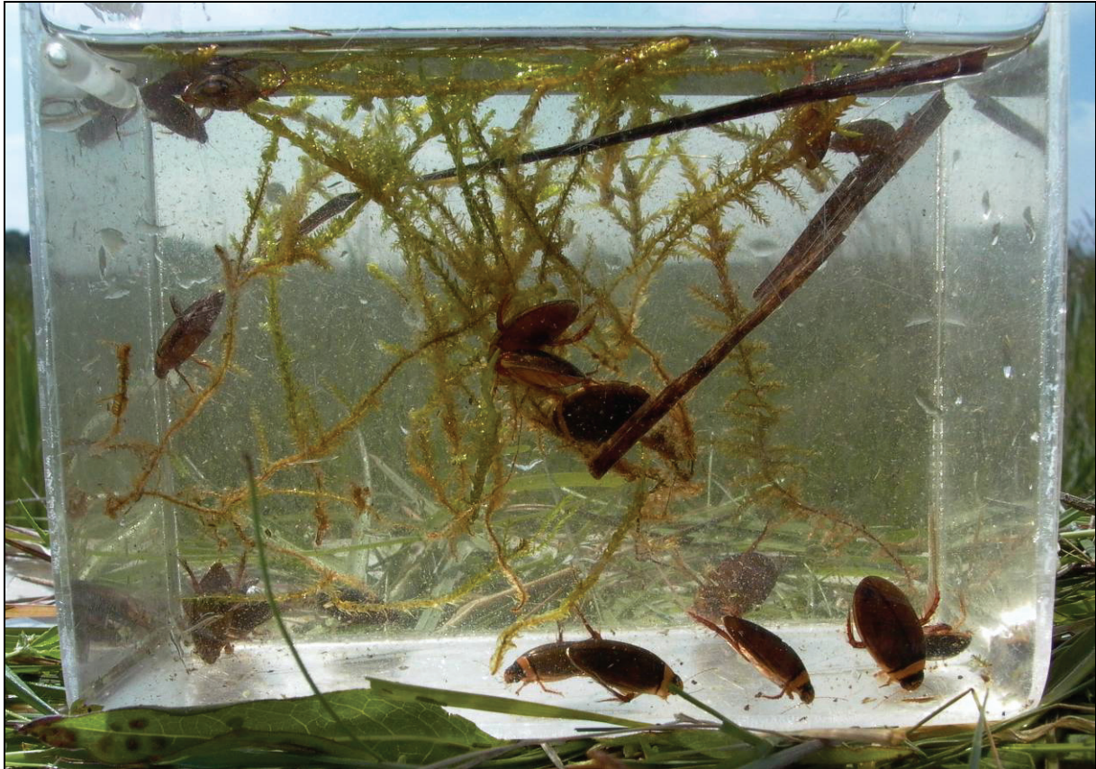
Abb. 1: Gefangene Exemplare des Graphoderus bilineatus aus dem Müritz Nationalpark.

Für Graphoderus bilineatus sind umgebaute Kunststoffpfandflaschen ausreichend, die zwischen den Wasserpflanzen im flachen Uferbereich (20-30 cm Wassertiefe) versenkt werden sollten. Wenn der ufernahe Bereich durch angrenzende Gehölze zu stark beschattet ist, dann kann es unter Umständen angebracht sein, die Flaschen weiter in Richtung Gewässermittle zu legen. Besonders geeignet sind besonnte Stellen, an denen die Wasser- oder Uferpflanzen etwas dichter wachsen. Die Fallen sollten nach Möglichkeit dicht unter der Oberfläche, mit einem Neigungswinkel von ca. 10-45° (Öffnung nach unten) auf oder zwischen diesen Pflanzen liegen. Die Anzahl der Fallen richtet sich im Allgemeinen nach der Gewässergröße, wobei allerdings eine Mindestmenge von 12 Stück pro Gewässer angebracht ist. Eigene Erfahrungen haben gezeigt, dass bei einer ausreichenden Anzahl von Fallen meistens schon eine einmalige Beprobung zu einem sicheren Ergebnis führt und damit weitere Störungen am Gewässer vermieden werden. Die Fallen sollten, je nach Witterung, etwa zwei bis vier Tage im Gewässer verbleiben.