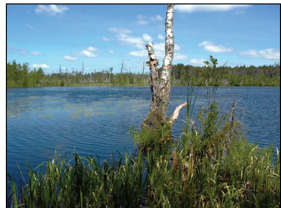
Abb. 3: Blick auf den Schwarzen See bei Grammertin. Im Hintergrund ist das vermoorte Nordufer mit den abgestorbenen Birken zu sehen.

03.06.2011 nicht gemessen 10 Individuen Der Schwarze See ist ein typischer Braunwassersee mit einem großen Verlandungsbereich im Nordwesten.