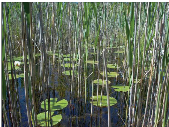
Abb. 4: Der Röhrichtgürtel des Kleinen Bodensees war reich an Makrophyten wie dem Gewöhnlichem Wasserschlauch ( Utricularia vulgaris ) und verschiedenen Characeen.

Der Kleine Bodensee befindet sich etwa 400 m östlich des Großen Bodensees und ist mit diesem durch eine ausgedehnte Röhrichtfläche verbunden. Eine Vielzahl an abgestorbenen und umgestürzten Bäumen sowie einige ertrunkene Torfstiche im Flachwasserbereich deuten auf eine Anhebung des Wasserstandes in den letzten Jahren hin. Im Schilfröhricht siedelten Characeen und Utricularia vulgaris in hoher Dichte. Dazu gesellten sich punktuell Torfmoose sowie der Sumpffarn Thelypteris palustris . Erstaunlich war die geringe Abundanz an Wasserkäferarten. Aufgrund der Gewässercharakteristik wurde das Vorkommen der FFH-Art Dytiscus latissimus vermutet und das Gewässer daraufhin sehr intensiv untersucht.