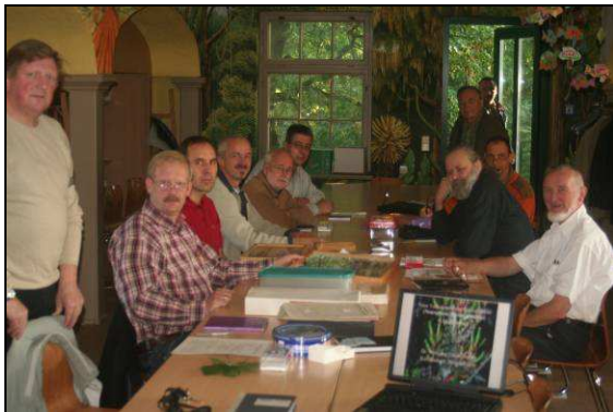
Abb. 1: Tagungsraum im Zoo Schwerin

Das Protokoll der Vorstandssitzung ist an alle Mitglieder des Vereins gesandt und gleichzeitig auf der Homepage des EVM „www.entomologie-mv.de“ veröffentlicht worden.