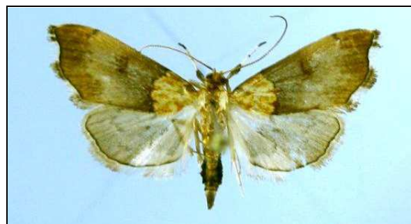
Abb. 6: Agroteta nemoralis (18 mm) (Nr. 6680)

6661 -hyalinalis (HÜBNER, 1796) Jatznick 03.07.2008, Neustrelitz 05.07.2006 (BAUMGARTEN)