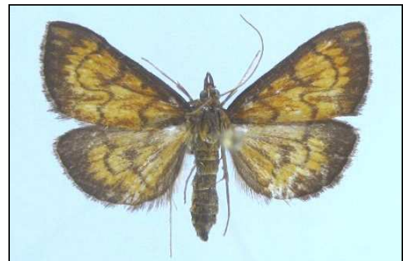
Abb. 5: Ecpyrrhorrhoe rubiginalis (16 mm) (Nr. 6588)

6588 Ecpyrrhorrhoe rubiginalis (HÜBNER, 1796) neu für MV, Altwarp 15.07.2007, Jatznick 17.07.2006 (TABBERT); Grünz 01.08.2003 (HOPPE)