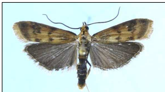
Abb. 2: Homoeosoma sinuella (16 mm) (Nr. 6072)

6072 Homoeosoma sinuella FABRICIUS, 1793 neu für MV. Prora 2002 (10F), 15.06.2003 (20F), 29.06.2009 (3F) (TABBERT)