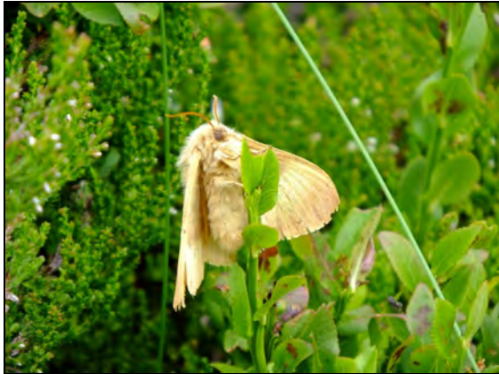
Abb. 8: In der hochmontanen Stufe tritt Lasiocampa quercus regelmäßig in nährstoffarmen Mooren auf, ohne eine typische Hochmoorart zu sein (Weibchen, Planai, Oberösterreich)

Neben den Mooren hat sich entlang von Ökotonen zumeist eine blütenreiche Flora entwickelt, die den Imagines hinreichend Nektarquellen bietet. Dieses Gefüge ist aufgrund der spezifischen orographischen Verhältnisse im (Hoch-) Gebirge diffus im Gelände vorhanden und nicht, wie im Tiefland, auf einige Punkte mit Moorbildungspotential konzentriert. Deshalb erscheint es zum einen so, als ob die tyrphobionten Arten überall vorkommen, zum anderen mischen sich im Hochgebirge vielfach Glazialrelikte und tyrphobionte Arten.