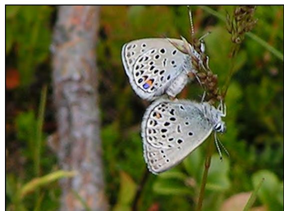
Abb. 4: Vacciniina optilete

Viele Autoren stellen fest, dass es zahlreiche tyrphobionte Arten gibt, die auch außerhalb von Mooren vorkommen (PEUS 1932, BERGMANN 1951 etc.).