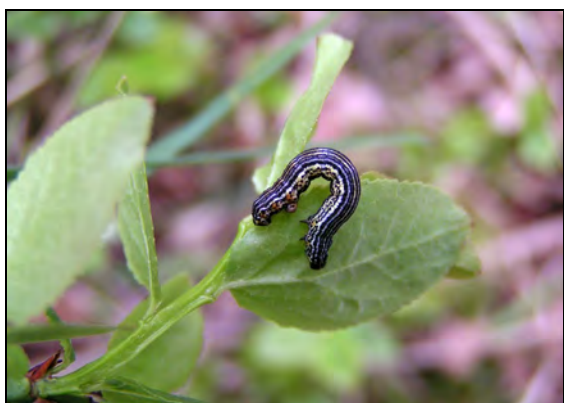
Abb. 6: Arichanna melanaria