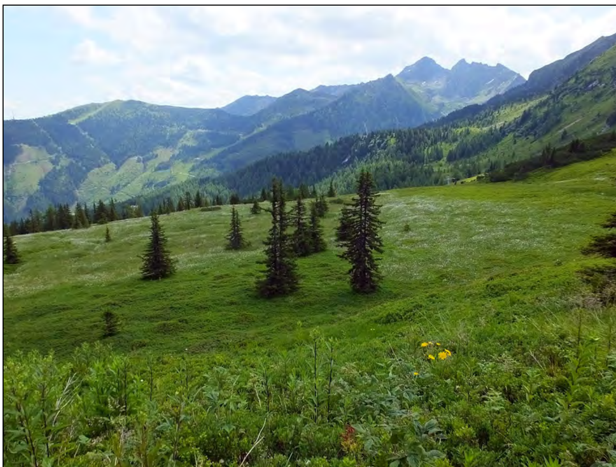
Abb. 7: Nährstoffarmes Moor mit Wollgrasdecke im Planai-Massiv (Österreich)

Dabei wird häufig der Hochmoorgebling Colias palaeno als Beispiel angeführt. Diese Beobachtungen kann der Autor aus dem österreichischen Hochgebirgsbereich bestätigen. Das oft flächige Auftreten dieser Arten auch außerhalb von Hochmooren ist mit verschiedenen Fakten zu erklären. So sind tyrphobionte Arten nicht an Torf gebunden, sondern vielmehr an spezifische mikroklimatische, strukturelle sowie Vegetationsverhältnisse von Mooren. Das sind insbesondere ein