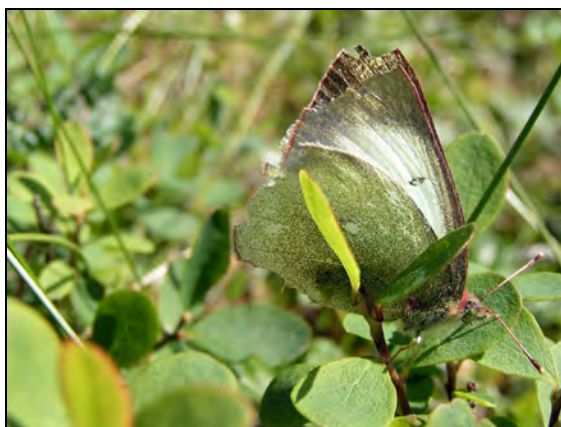
Abb. 3 Typische tyrphobionte Art Colias palaeno

Alle hochmoortypischen Tagfalterarten sind offensichtlich im Teufelsmoor bei Horst, im Rugenseemoor bei Bützow, im Tessiner und Neuendorfer Moor (Schaalseebereich) sowie im Schönwolder Moor lokal ausgestorben.