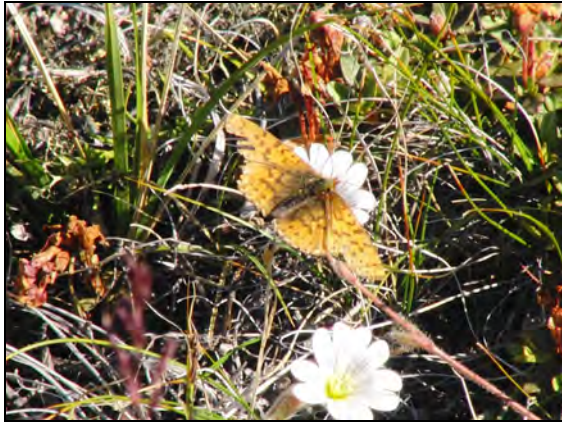
Abb. 2: Eine Art, die die Eiszeiten „überdauerte“, ist Clossiana chariclea .