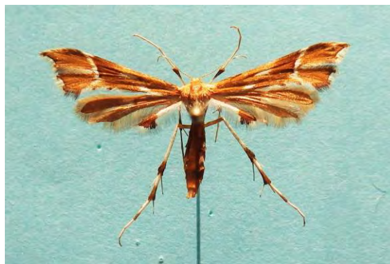
Abb. 3: Cnaemidophorus rhododactylus (D. & S.), 25 mm.

[01.07.- 27.07.//14.09.] Dargast 2003, Negast 2010, 2016, Zudar 2013, Altwarp 2013, Grünz 2012, 2013, Ahlbeck/Seegrund 2016, Prora 2003, 2011 (Tabbert); Fienstorf 2004 (Rudolph); Neustrelitz 2000-2001 (Hoppe); Neustrelitz 2006 (Baumgarten).