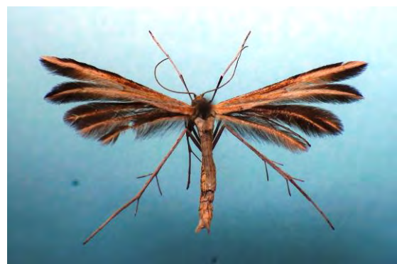
Abb. 6: Merrifieldia leucodactyla (D. & S.), 20 mm.

[Raupe überwintert, 05.07.-28.08.] Franzburg/Hellberge 2007, 2008, 2015, Gützkow/Peenetalwiesen 2012, 2013 (leg. und det. mit GU Tabbert); Gützkow/Peenetalwiesen 2001 (Hoppe); Neustrelitz 2006 (Baumgarten).