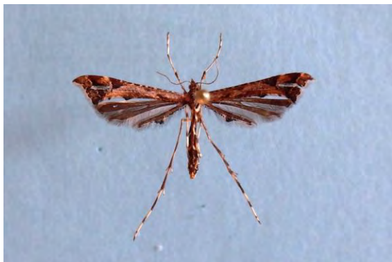
Abb. 2: Amblyptilia punctidactyla (Haw.), 21 mm.

[17.08.-21.10.-Winter-20.05.//Juni und Juli] Negast 2013 bis 2016 (1 Falter ex larva 17.08.) (Tabbert).