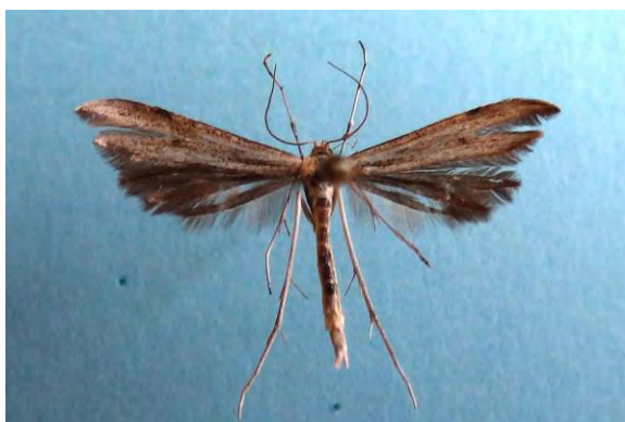
Abb. 7: Euleioptilus didactylites (Haw.), 21 mm.

[Raupe überwintert, 24.06.-22.08.] Rügen/Mönchgut/Teschenberg 2013, 2014, Negast 1994, Neuhaus/Graudüne 2014 (leg. und det. mit GU Tabbert); Dudendorf 2001 (Hoppe).