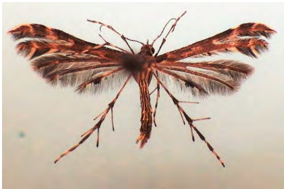
Abb. 4: Oxyptilus tristis (Z.), 14 mm.

Grabower Heide/Ludwigslust 27.09.2016 (leg. und det. mit GU Tabbert).