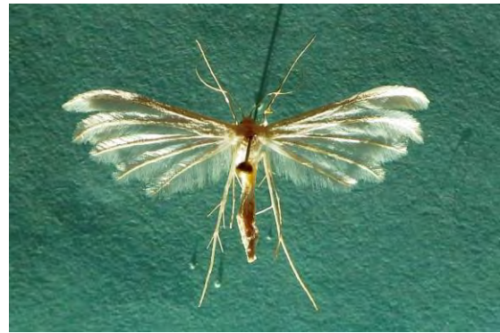
Abb. 5: Pterophorus pentadactyla (L.), 28 mm.

[Raupe überwintert, 03.06.-22.07.] Försterhofer Heide 1992, Karlshagen 2006, Stedar/Streuobstwiese 2010, Zudar 2013, Mannhagener Moor 2012, Endingen 2016, Neustrelitz/Wesenberger Chaussee 2015, Grünz 2016 (Tabbert).