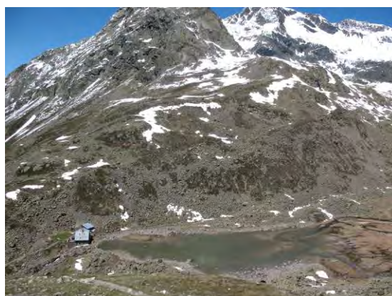
Abb. 6: An der Winnebachseehütte; Fundplatz von Parammoecius gibbus (Germar & Kaulf.). Auf der Oberfläche des Schmelzwassersees trieben zahlreiche Agolius abdominalis (Bon.).