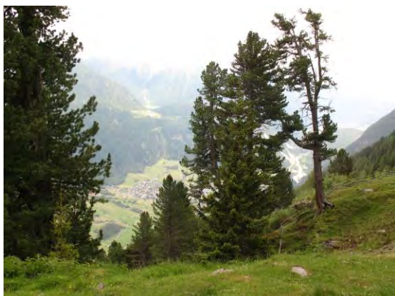
Abb. 3: Blick von der Gehsteigalm ins Tal. Fundplatz von Onthophagus fracticornis (Preysl.) und Oromus alpinus (Scop.).