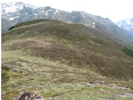
Abb. 9: Poschachkogel, 2500 m. Bis in etwa 2400 m wurden die fliegenden Waldmaikäfer aus dem Tal verdriftet.