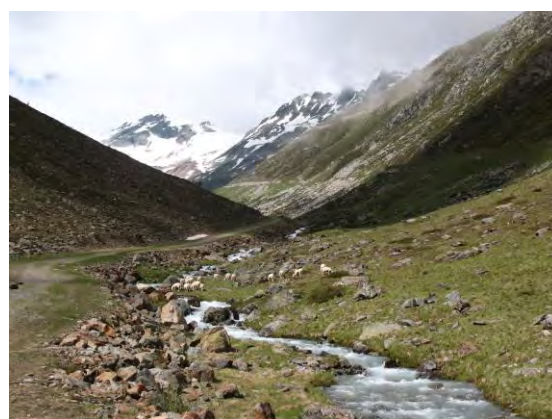
Abb. 11: Rettenbachalm bis 2600 m Höhe. Noch in 2500 m kam Anoplotrupes stercorosus (Scriba) vor, neben Agolius abdominalis (Bon.), Amidorus obscurus (F.) und Oromus alpinus (Scop.).