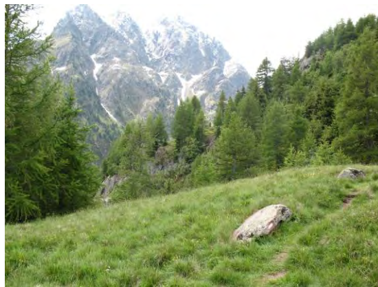
Abb. 4: Auf dem Weg zum Hahlkogelhaus. Fundplatz von Onthophagus baraudi Nic.