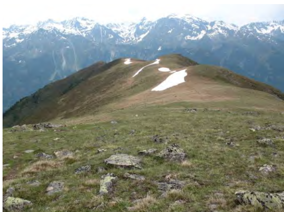
Abb. 8: Narrenkogel mit alpinen Matten in 2200-2300 m Höhe.