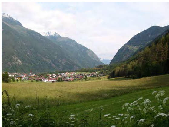
Abb. 1: Blick auf Umhausen in etwas über 1000 m Höhe.