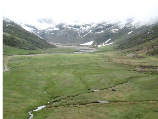
Abb. 10: Hochebene zwischen der Amberghütte und dem Sulztalferner. Zahlreiches Vorkommen von Agolius abdominalis (Bon.).