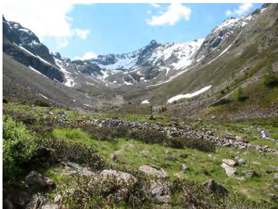
Abb 7: Grastalalm in über 2000 m Höhe.