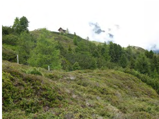
Abb. 5: Hahlkogelhaus in 2000 m; Fundplatz von Agrilinus convexus (Er.), Agoliinus satyrus (Reitt.) und weiterer hochmontan-alpiner Arten. In recht großer Zahl trat Anoplotrupes stercorosus (Scriba) auf.