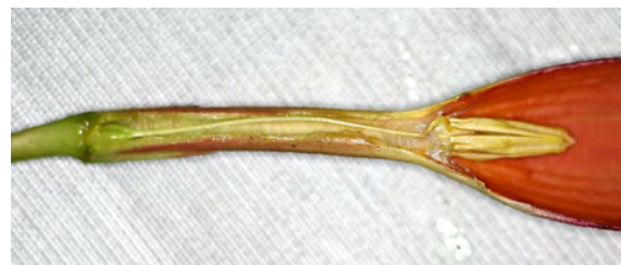
Abb. 3: Aufgeschnittene Dipladenia -Blüte, die im oberen Teil den Haarkranz erkennen lässt, der den Rüssel von Macroglossum stellataria festhält. Gut zu erkennen ist auch der tiefe Blütenkelch mit dem nektargefüllten Blütenboden.