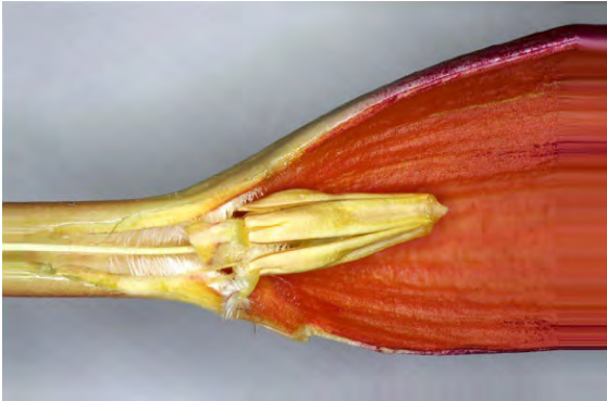
Abb. 4: Blick in eine aufgeschnittene Blüte. Gut zu erkennen ist die „Behaarung“ im Bereich der Staubbeutel, in denen sich vermutlich der Rüssel von Macroglossum stellatarum beim Blütenbesuch verhakt.

Will der Schmetterling den tief in der Blütenröhre sitzenden Nektar erreichen, muss er seinen Saugrüssel an diesen Borstenpolstern vorbeiführen. Da die Borsten nach unten gerichtet sind, wirken sie als Widerhaken und klemmen den rillenbesetzten Saugrüssel fest. Der Schmetterling wird bei seinem Befreiungsbemühen am Rüsselansatz und Stirnbereich mit Pollen kontaminiert. Gleichzeitig kann von einem früheren Blütenbesuch anhaftender Pollen auf die Narbe übertragen und somit die Bestäubung der Blüte bewerkstelligt werden.