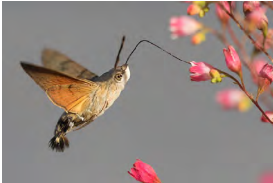
Abb. 1: Taubenschwänzchen beim Blütenbesuch. Während des Fluges wird der 25-28 mm lange Rüssel in den Blütenkelch eingeführt.

Im Jahr 2018 konnte in Mecklenburg-Vorpommern ein starker Einflug des Taubenschwänzchens Macroglossum stellatarium (Linnaeus, 1758) (Sphingidae) beobachtet werden. Vermutlich waren die Bedingungen für diesen Wanderfalter aufgrund des lang anhaltenden trockenen Sommers 2018 in ganz Deutschland und Mitteleuropa besonders günstig.