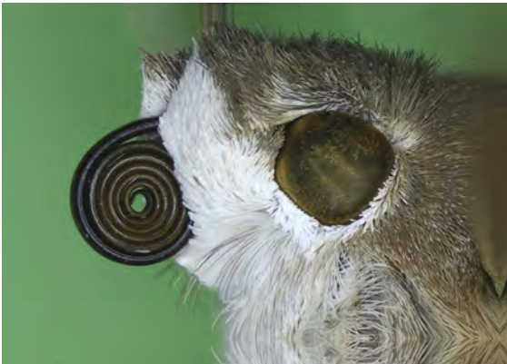
Abb. 5: Kopf des Taubenschwänzchens mit aufgerolltem, fein gerilltem Saugrüssel.

Es war zu vermuten, dass nach erfolgter Bestäubung die Widerhakenhaare welken und den Schmetterling wieder freigeben.