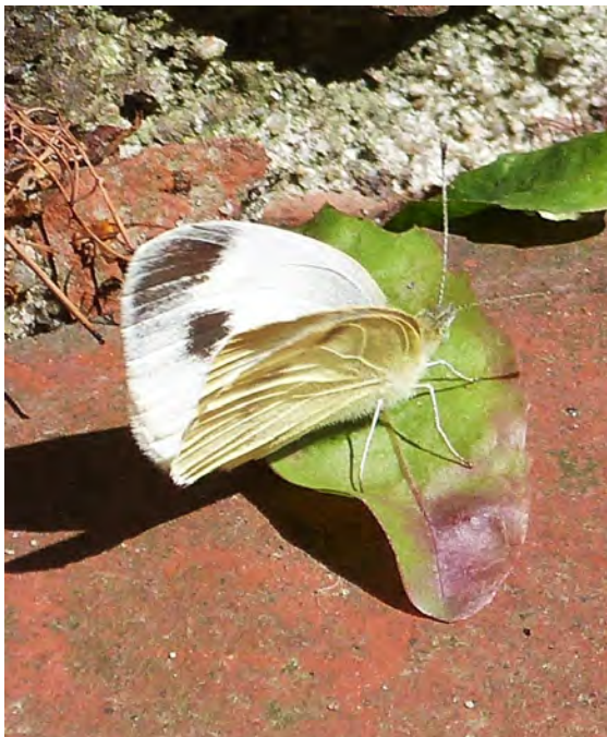
Abb. 1: Weibchen des Karstweißlings im Garten des Autors.

Der Karstweißling, der bisher nur südlich des Alpenkamms weit verbreitet war, wurde im August 2008 in Baden-Württemberg erstmals in Deutschland beobachtet (HERRMANN 2008). Seit 2016 liegen Nachweise aus Niedersachsen vor (HENSLE & ZIEGLER 2015). Der Erstdnachweis von Pieris mannii im Wendland gelang am 17. Mai 2018 in Tießau bei Hitzacker an der Elbe (KÖHLER 2018). Seit dieser ersten Beobachtung sind an gleicher Stelle bis zum 30. September insgesamt 33 sicher bestimmte Falter in vermutlich vier Generationen erfasst worden, 12 Männchen und 21 Weibchen (Abb. 1, 2).