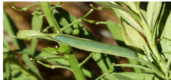
Abb. 3: Erwachsene Raupe auf Schleifenblume.