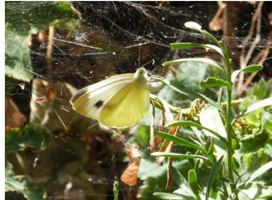
Abb. 2: Pieris mannii bei der Eiablage an Schleifenblume.

Puppen, so dass bereits im Jahr des Erstfundes von einer überraschend individuenstarken Population ausgegangen werden kann.