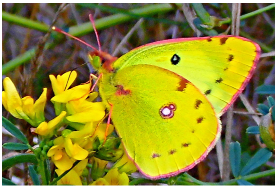
Colias cf. hyale (L., 1758) (Pieridae).