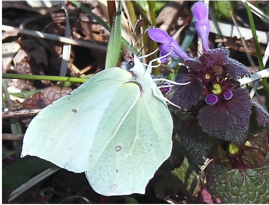
Gonepteryx rhamni (L., 1758), ♀ (Pieridae).