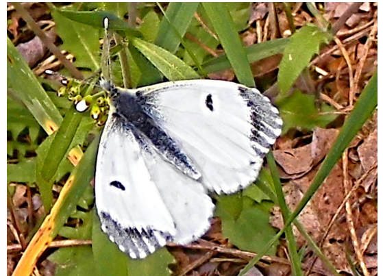
Anthocharis cardamines (L., 1758), ♀ (Pieridae).