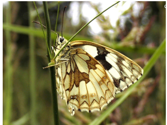
Melanargia galathea (L., 1758) ♀ (Nymphalidae).