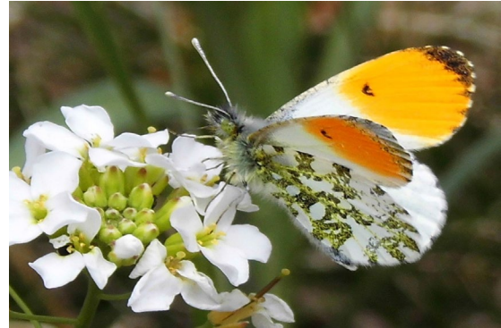
Anthocharis cardamines (L., 1758), ♂ (Pieridae).