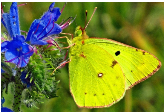
Colias cf. alfacariensis Ribbe, 1905 (Pieridae).