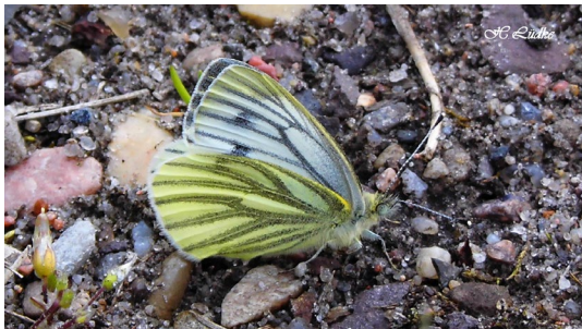
Pieris napi (L., 1758), ♀ (Pieridae).