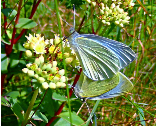
Pieris rapae (L., 1758), Paarung (Pieridae).