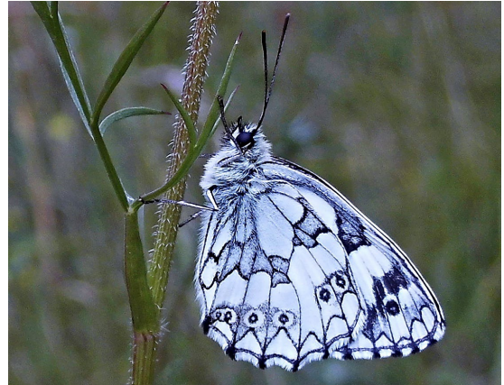
Melanargia galathea (L., 1758) ♂ (Nymphalidae).