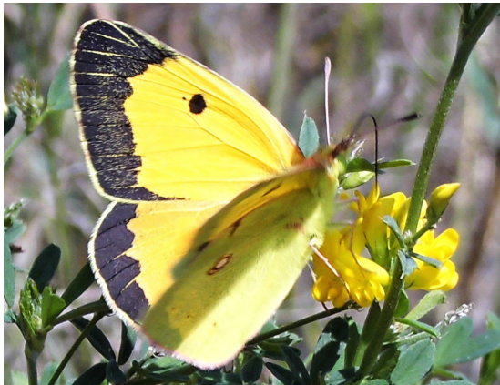
Colias croceus (Geoffroy in Fourcroy, 1785) (Pieridae).