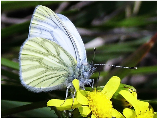
Pieris napi (L., 1758), ♂ (Pieridae).