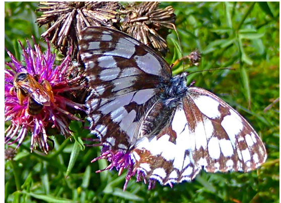
Melanargia galathea (L., 1758) ♀ (Nymphalidae).