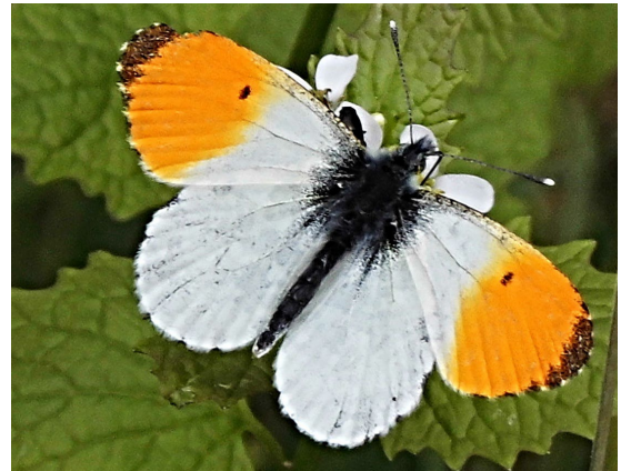
Anthocharis cardamines (L., 1758), ♂ (Pieridae).