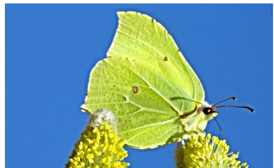
Gonepteryx rhamni (L., 1758), ♂ (Pieridae).