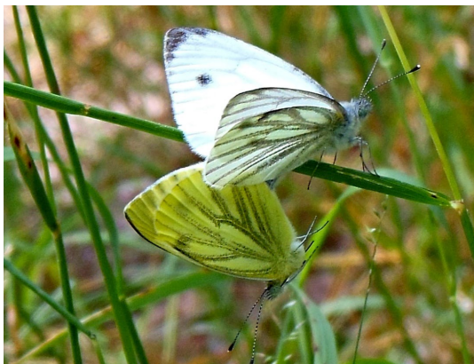
Pieris napi (L., 1758), Paarung (Pieridae).